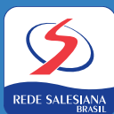
P. Ángel Fernández Artime

Na apresentação da Estreia deste ano, 2020, o Reitor-mor pede que ela seja “o fio condutor” da pastoral em todas as atividades que realiza no mundo salesiano. Para a educação e a evangelização dos jovens e das jovens, a Família Salesiana de Dom Bosco herdou o binômio “Bons Cristãos e Honestos Cidadãos”. Constata-se uma crescente fragilidade no sentido de que nem sempre somos apóstolos missionários e nem sempre educamos os jovens para a cidadania.